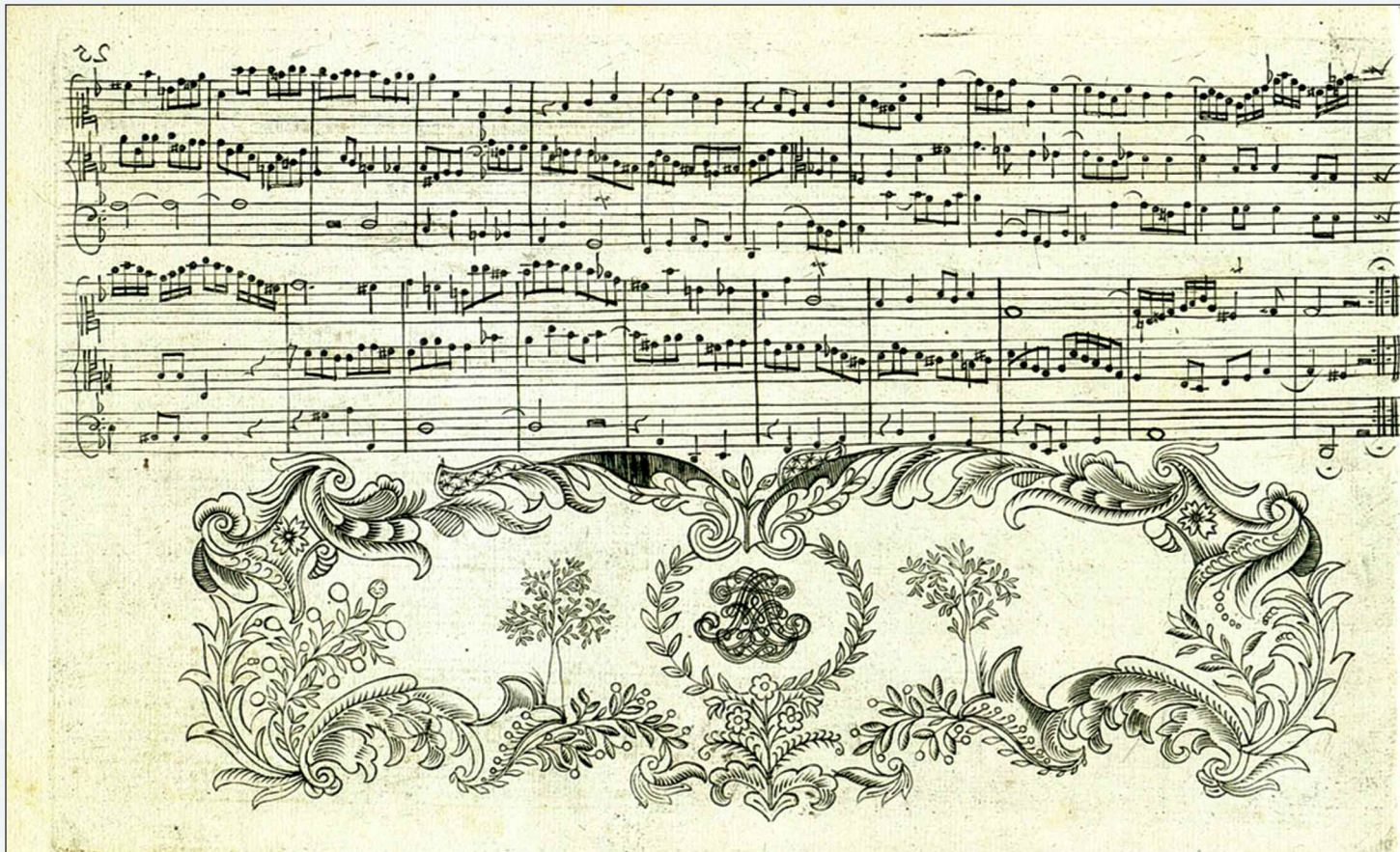
The end of Contrapunctus 8 in the first edition

each). This is a perfect example. One subject has leaps; another has repeated notes but remains tight; the third is expressive and legato. They all cleverly begin at a different part of the bar.